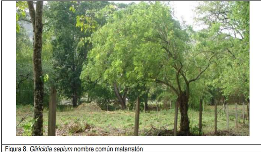
Figura 8. Gliricidia sepium nombre común matarratón

metros lineales al perímetro de las 3 hectáreas, la cual estas plántulas se calcula que producirán un promedio de 1,29 ton/año después de alcanzar los 9 meses de crecimiento.