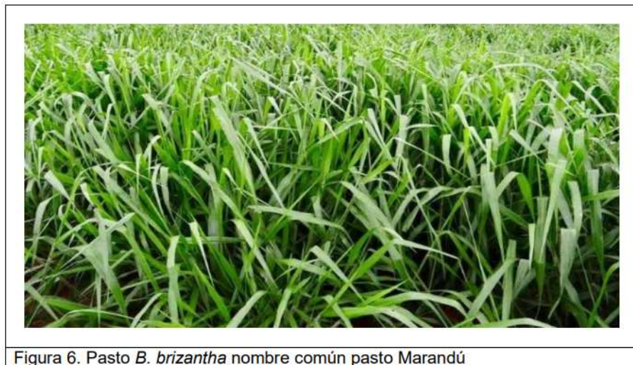
Figura 6. Pasto B. brizantha nombre común pasto Marandú

monocultivo se debe fertilizar por hectárea con 20 kilos de Nitrógeno, cuando el pasto tenga una altura entre 20 – 30 centímetros. Además, en suelos de mediana fertilidad se debe fertilizar para mantener productividad cada 3 años.