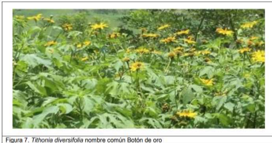
Figura 7. Tithonia diversifolia nombre común Botón de oro

Vigilada Ministerio de Educación Nacional