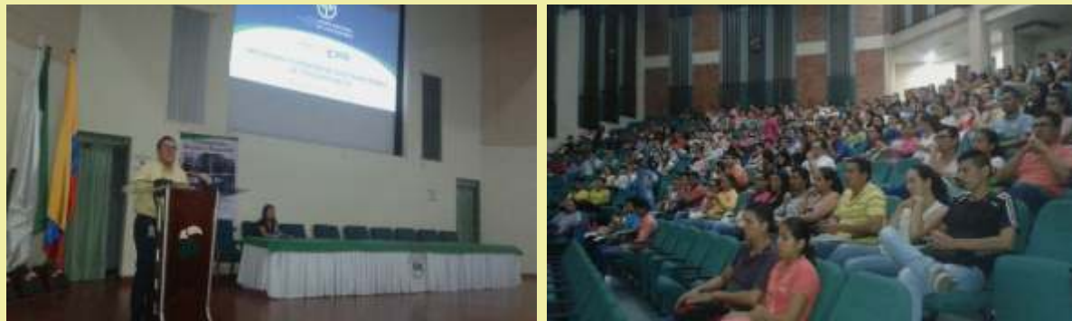
Apertura y asistencia de estudiantes a la Conferencia de la Junta Central de Contadores Públicos Auditorio Angel Cuniberti-Universidad de la Amazonia