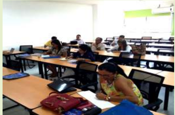
Colectivo docente en jornada de capacitación periodo intersemestral

Temas importantes para el desarrollo normal de las actividades académicas e investigativas en nuestro programa de Contaduría Pública.