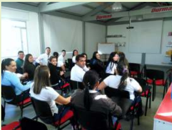
Instalaciones empresa Durman

El 20 de abril de 2016, estudiantes del X semestre del programa de Contaduría Pública, Visitan la empresa Industrial Durman, que se dedica a la fabricación de soluciones integrales para los mercados de conducción de fluidos, como tuberías y accesorios, sistemas de ingeniería y productos innovadores para clasificarlos en varios segmentos, la visita realizada por los estudiantes de X semestre de Contaduría Pública (Madrid Cundinamarca), se basó en el conocimiento de los procesos de costos así como visita a las diferentes plantas de los procesos de elaboración de tuberías. Por otro lado tuvieron la oportunidad de conocer los procesos de auditoría en sistemas de información.