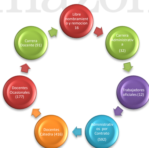
DISTRIBUCIÓN PLANTA DE PERSONAL Gráfico No. 1 Corte a diciembre de 2025