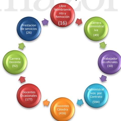
Grafico No. 1 Corte a Septiembre de 2025