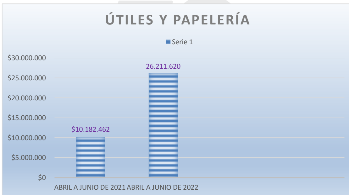
Grafico No. 2 Útiles y papelería

De acuerdo a la información suministrada por la dependencia de Almacén tenemos que: